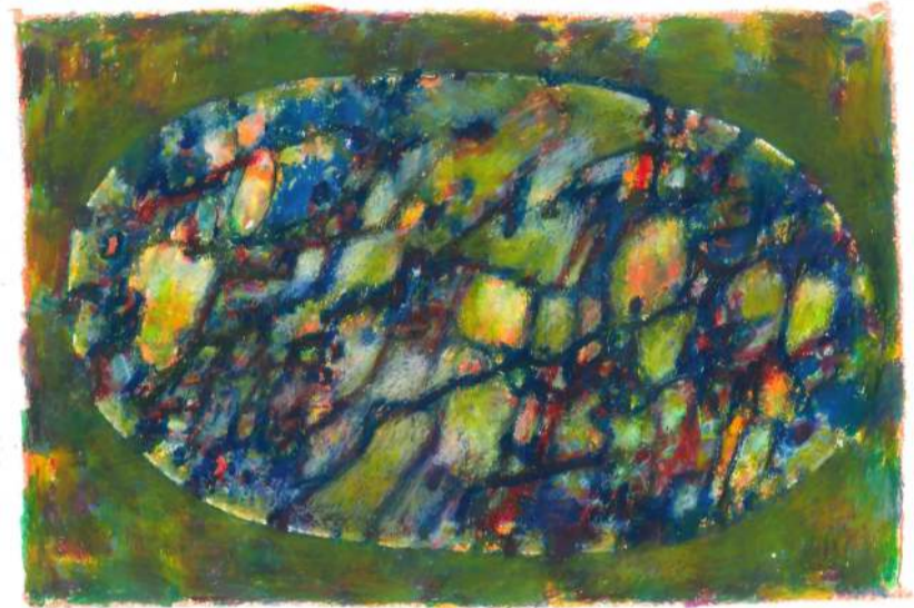
La beaute de la nature III pastel, 33 x 15 cm, 2019