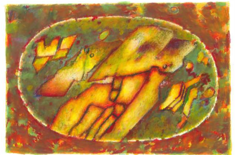
Tematy ornitologiczne IV pastel, 33 x 15 cm, 2019