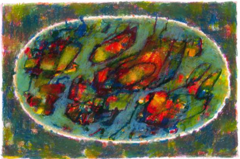
Orszak II pastel, 33 x 15 cm, 2019