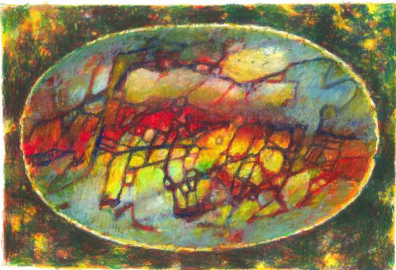
Tajemnicze puzzle pastel, 33 x 15 cm, 2019