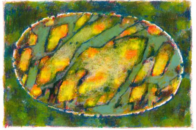
Fragment fresku pastel, 33 x 15 cm, 2019