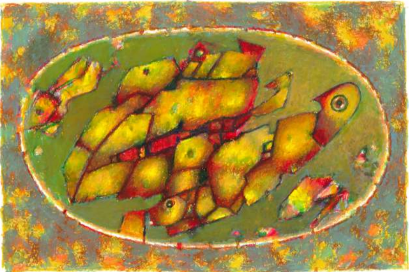
Tematy ornitologiczne I pastel, 33 x 15 cm, 2019