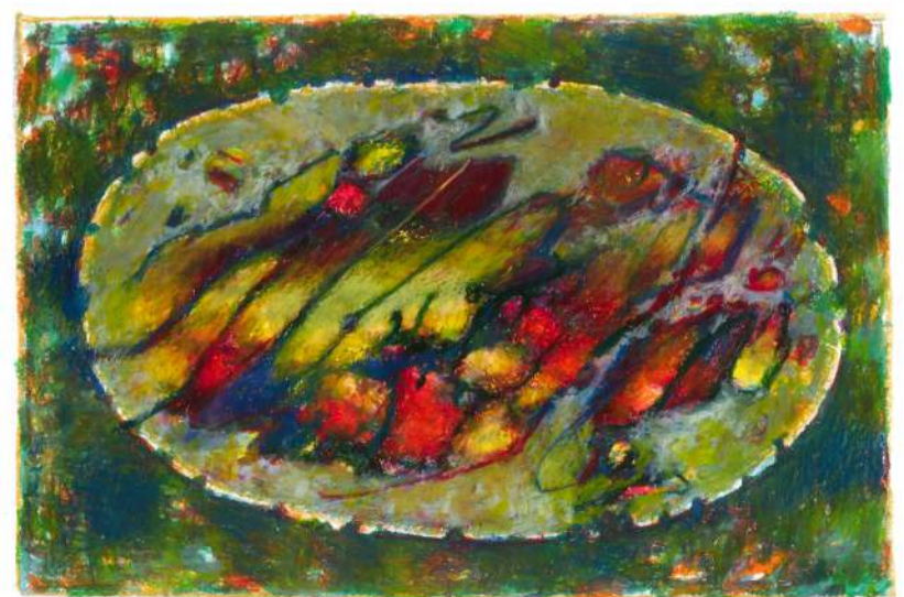
Ucieczka II pastel, 33 x 15 cm, 2019