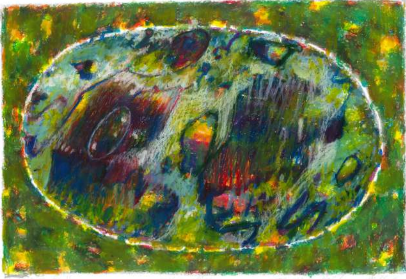
Dialog III pastel, 33 x 15 cm, 2019